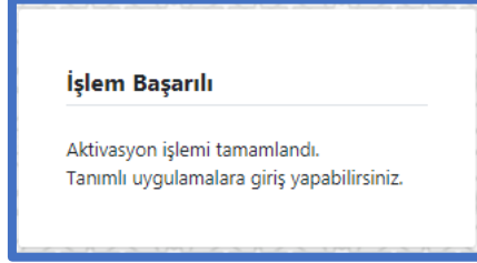
Şekil 5 İşlem Başarılı Bilgisi

Girilen bilgiler ile doğrulama işlemi tamamlandığında ekranda “İşlem Başarılı” yazısı görüntülenir. (Bknz. Şekil 5)